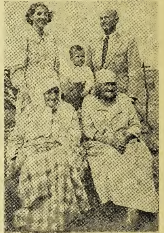
(El Sombrerito R. A.)